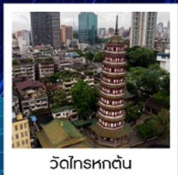
วัดโหลหุตัน