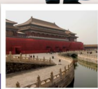
พระราชวังกู้กง