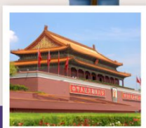
เทียนอันเหมิน

กำแพงเมืองจีนด่านจวิหยงกวน / สนามกีฬาปักกิ่ง / ช้อปปิ้งย่านซานหลี่ตุ่น / วัดลามะ จัตุรัสเทียนอันเหมิน / พระราชวังโบราณกู้กง / หอประชุมเทียนถาน / พระราชวังฤดูร้อนอวิ๋เหอหยวน