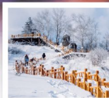
ภูเขาหิมะ