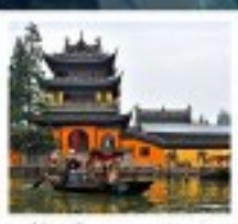
หมู่บ้านโบราณซูโจว

สวนสนุกดิสนีย์แลนด์ปักกิ่ง / สวนสนุกเซี่ยงไฮ้ดิสนีย์แลนด์ / หมู่บ้านโบราณซูโจว ขึ้นหอไข่มุก / ลอดอุโมงค์ทะเลสาบ / หาดไว่ทาม / จิตรกรรมอันยิ่งใหญ่ พระราชวังโบราณกู้กง / กำแพงเมืองจีนด่านหยงกวน สนามกีฬาโอลิมปิกปักกิ่ง / ถนนโบราณเฉียนเหมิน