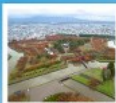
โทริยิวกะกุ ทาวเวอร์

หุบเขานรกจิโตะคุดาบิ / โทดองฮิจูเอ็งคานเนิมชิ ตลาดเช้าเมืองฮาโกดาเตะ / โทริยิวกะกุ ทาวเวอร์ ภูเขาไฟอุสุ / จุดชมวิวยุซึกิ / ค่องเรือชมทะเลสาบโทบะ สวนอุสึกิโตะ / สวนพฤกษศาสตร์ / เก็บผลไม้ / สัมผัสน้ำพุร้อนที่วิว พิพิธภัณฑ์หอคอยดนตรี / นาฬิกาไอน้ำโบราณ / โรงเบียร์โทบะอิชิ เนินพระพุทธรเจ้า / ถนนฮิโอบิซึงาบุทซึ / ย่านฮูซึโทบะ