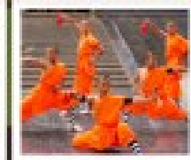
โชว์ราชวงศ์

PERIOD 1 : 9 - 14 สิงหาคม | PERIOD 2 : 18 - 23 ตุลาคม 2567