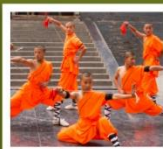
โซ่วเล่าหลิน

กำแพงเมืองโบราณซีอาน / วัดลามะ / ตลาดมุสลิม ป่าเจดีย์ / โชว์การแสดงวิทยายุทธเส้าหลิน / โชว์ราชวงศ์ถัง อุทยานหยุ่นโกซาน / ศาลเจ้ากวนอู / ถ้ำหินหลงเหมิน / วัดเส้าหลิน พิพิธภัณฑ์กองทัพใต้ดินทหารม้าจีนซี / ถนนคนเดินวัฒนธรรมต้าถิง