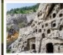
กำแพงหลงเหมิน