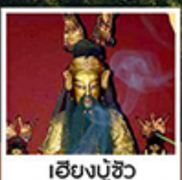
เอียงบู๊ซิว