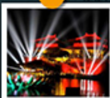
สวนชิงหิงซ่างเหอหยวน