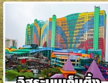
อิสระบนเก็นติ้ง