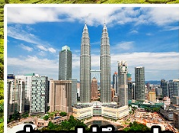
ถ่ายรูปคู่ตึกแฝด