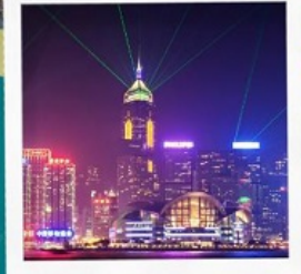
SYMPHONY OF LIGHT