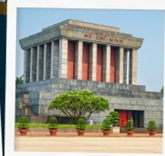
สุสานโฮจิมินห์