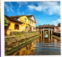
เมืองโบราณฮอยอัน