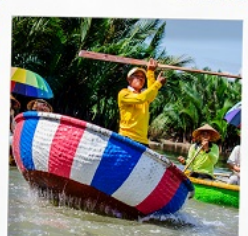
เรือกระดัง