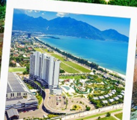
Mikazuki Japanese Resorts & Spa