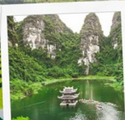
ล่องเรือจางอาน