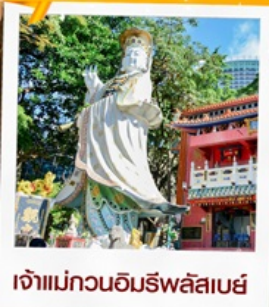
เจ้าแม่กวนอิมรพัสลเบย์

23 กุมภาพันธ์ 2568 วันยืมเงินเจ้าแม่กวนอิม วัดสองอำ