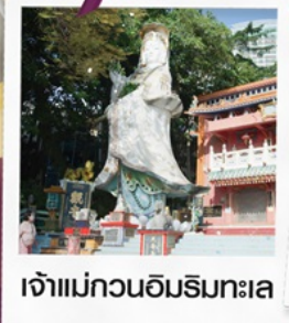
เจ้าแม่กวนอิมริมทะเล