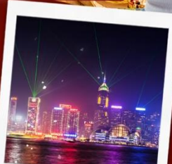
ชมโชว์ SYMPHONY OF LIGHT