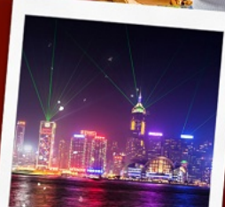
ชมโชว์ SYMPHONY OF LIGHT