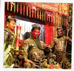
เทพเจ้ากวนอู วัดถวณไถ