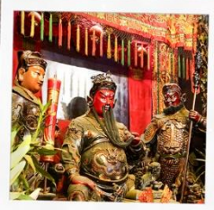
เทพเจ้ากวนอู วัดกวนไท