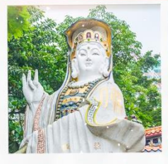
เจ้าแม่กวนอิมรพัสสิปีย์