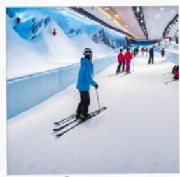
บ้านหิมะ WINDOW OF THE WORLD