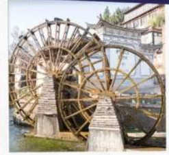
เมืองเก้าลี่เจียง