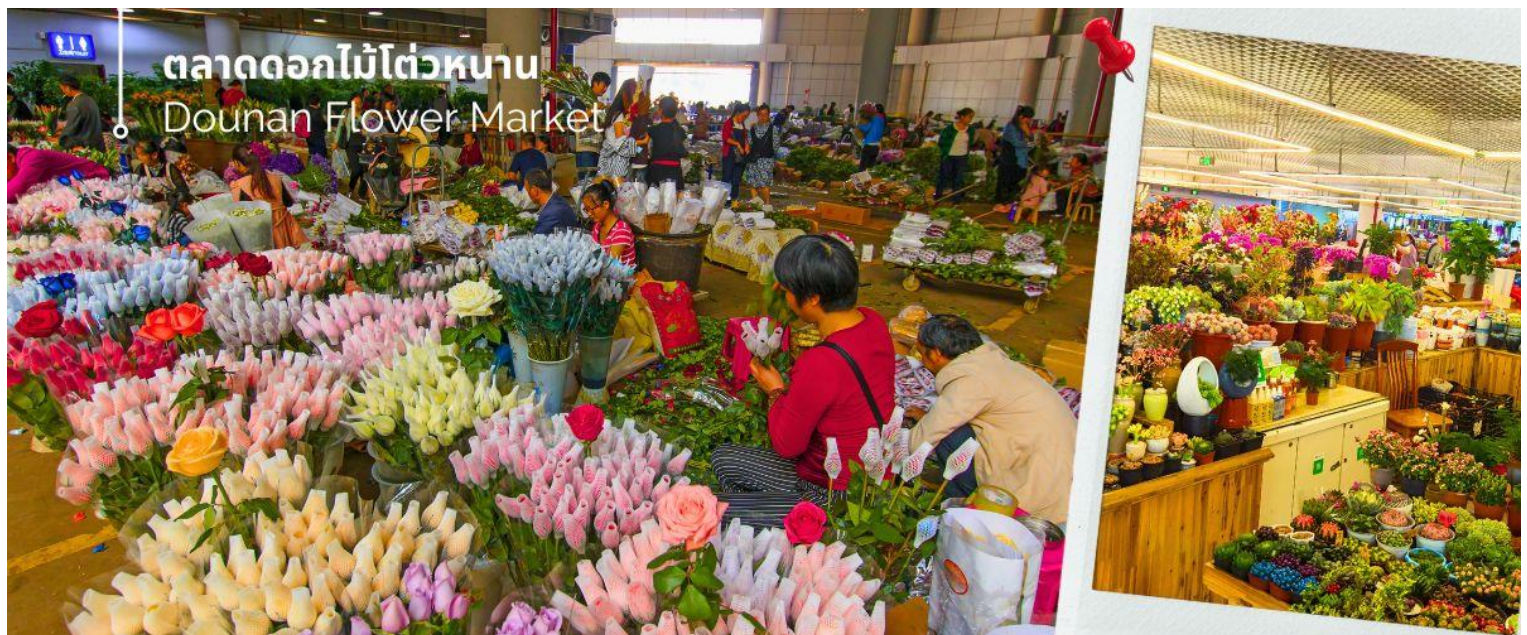
ตลาดดอกไม้ไต้หวัน Dounan Flower Market

นำท่านชม ตลาดดอกไม้ไต้หวัน เป็นตลาดค้าส่งดอกไม้ที่ใหญ่ที่สุดของจีน เปิดทำการค้าตลอด 24 ชั่วโมง ไม่มีช่วงเวลาปิดทำการ โดยในปี 2566 ตลาดดอกไม้ไต้หวันมีปริมาณการซื้อขายดอกไม้โดยเฉลี่ยรวม 13,540 ล้านดอก คิดเป็นมูลค่า 13,570 ล้านหยวน ถือเป็นตลาดค้าปลีก-ส่ง ผลิตผลทางการเกษตรที่ใหญ่ที่สุดในประเทศจีนอีกด้วย