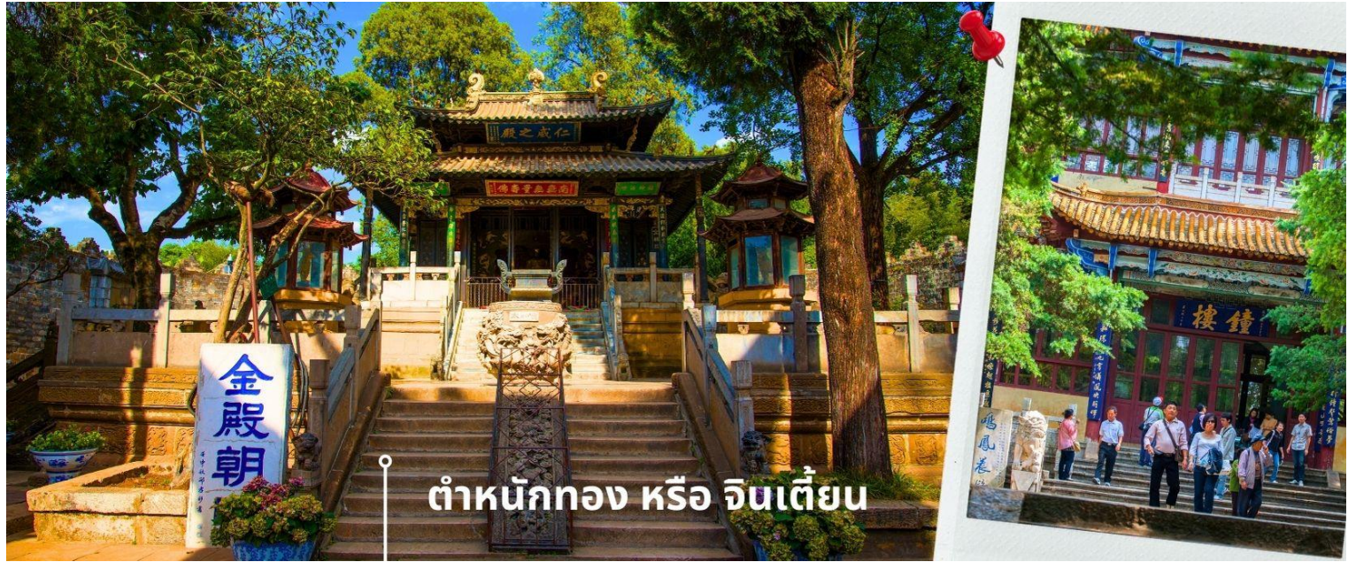
ต้าหนังกทง หรือ จินเตี้ยน

เที่ยง 📍 รับประทานอาหารกลางวันที่ภัตตาคาร (14) นำท่านเยี่ยมชม ต้าหนังกทง หรือ จินเตี้ยน (The Golden Temple Park | Jindian park) (ไม่รวมค่ารถแบตเตอรี่ 10 หยวน/ท่าน) โบราณสถานสำคัญของมณฑลยูนนาน ที่ได้รับการปกป้องดูแลโดยรัฐบาลจีน ตั้งอยู่บริเวณเชิงเขาหมิงเฟิง ล้อมรอบด้วยแนวกำแพงและหอคอยเหมือนเป็นป้อมปราการ ต้าหนังกทงถูกเรียกตามลักษณะอาคารที่มีสีทองอร่าม จากทองเหลืองในส่วนของผนังและหลังคา รวมกว่า 200 ตัน โดยถือเป็นสิ่งปลูกสร้างสัมฤทธิ์ที่ใหญ่ที่สุดของจีน ภายในมีรูปปั้นทองโดยมีเงินอยู่ (เสวียนอู่) เทพเจ้าลัทธิเต๋าเป็นองค์ประธาน