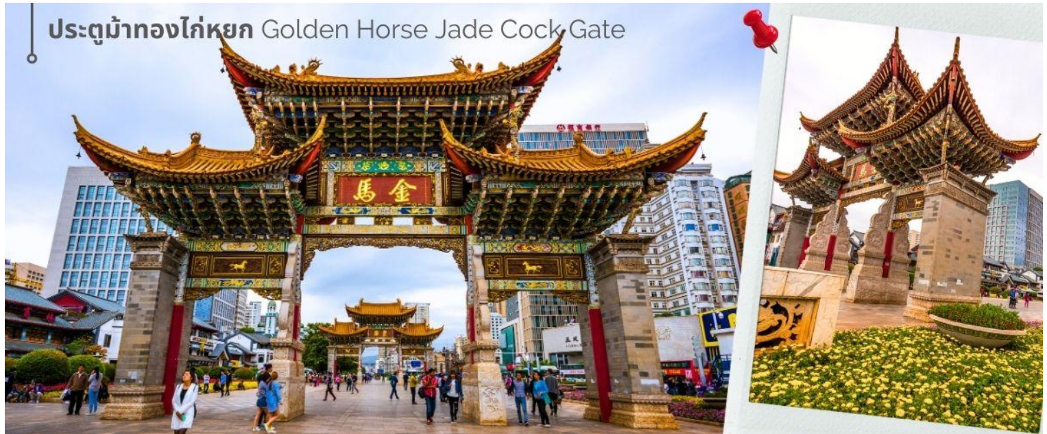
ประตูม้าทองไก่อหยก Golden Horse Jade Cock Gate

ชม ซุ้มประตูม้าทอง และ ซุ้มประตูไก่อหยก ซึ่งภาษาจีนเรียกว่าจินหม่า และปี้จี จิ้งเออคำย่อ จินปี้ มาชานานนามถนนแห่งนี้ ซุ้มม้าทองและไก่อหยก มีอายุร่วม 400 ปี สร้างขึ้นในสมัยราชวงศ์หมิง ในถนนย่านการค้าแห่งนี้ เป็นแหล่งเสื้อผ้าแบรนด์เนมทั้งของจีนและต่างประเทศ รวมทั้งเครื่องประดับ อัญมณี ร้านเครื่องดื่ม และร้านขายของที่ระลึกมากมาย