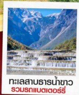
ทะเลสาบธารน้ำขาว รวมรถแบริดเตอร์รี่