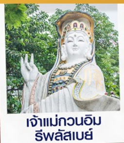
เจ้าแม่กวนอิม ธิวลีสเบย์