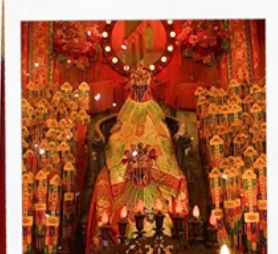
เจ้าแม่กวนอิมวัดสองฮา