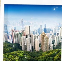
จุดชมวิวยุทธศาสตร์