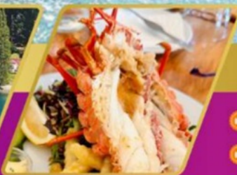
ทุ่งมิงกรท่ามกลางธรรมชาติ