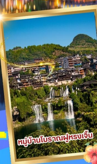
หมู่บ้านโบราณฝูหลงเจิ้น