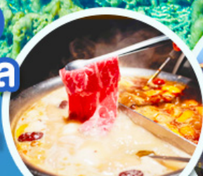
ชาบูหม่าล่า