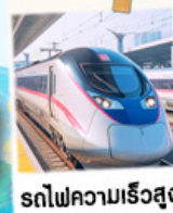
รถไฟความเร็วสูง