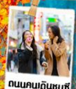
ถนนคนเดินชุนซี