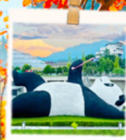
แพนด้าเซลล์