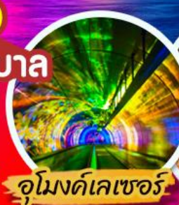
อุโมงค์เลเซอร์