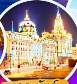
เดอะบันด์