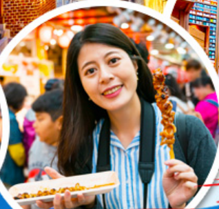
ตลาดควางจ้ง