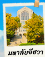
มหาวิทยาลัยชวา