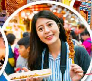
- ตลาดควางจั้ง