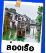
ล่องเรือ