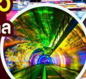
อุโมงค์เลเซอร์