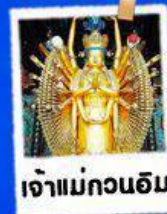
เจ้าแม่กวนอิม