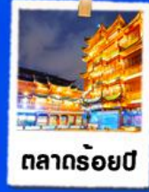
ตลาดร้อยปี