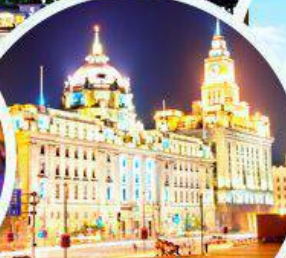
เดอะบันด์