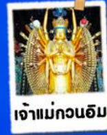
เจ้าแม่กวนอิม