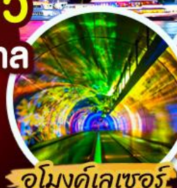
อุโมงค์เคเซอร์