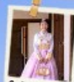
ใส่ชุดฮันบก