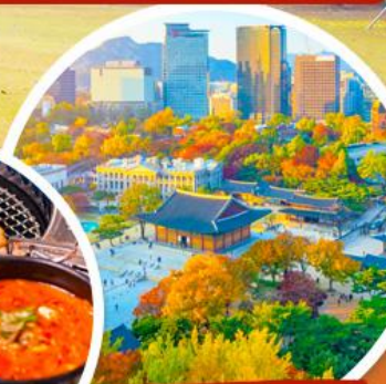
พระราชวังถ็อกชุกุง