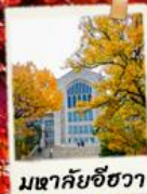
เมดัลยชีชวา