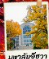
เมฆาคับขีฮวา