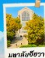
มหาศาลยชวา