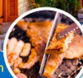
หมู่บ้านเกาหลี