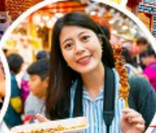
ตลาดควางจง