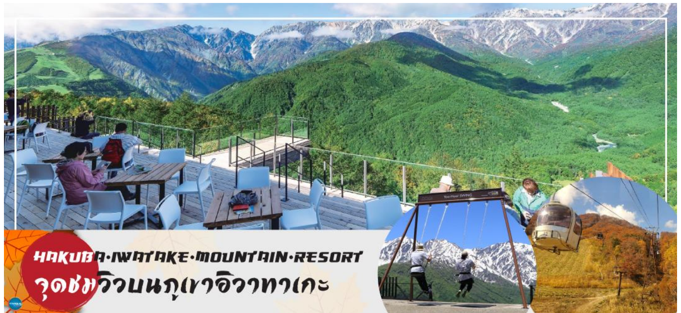
HAKUBA IWATAKE MOUNTAIN RESORT จุดชมวิวนภูเขอิวาทาเกะ

วันที่สี่ เมืองมัตสึโมโตะ – เมืองนากาโนะ – ฮาคูบะ – HAKUBA IWATAKE MOUNTAIN RESORT (คอนโดล่า ลิฟท์) – ไร่อาซาฮิไดโอะ – เมืองยามานาชิ – อุโมงค์ไบเมเบิล (ขึ้นอยู่กับฤดูกาล) – หมู่บ้านโอชิโนะสั๊กไก – ออนเซ็น + ชาบูยักษ์