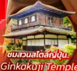
ชมสวนสโตนี่ญี่ปุ่น... Ginkakuji Temple