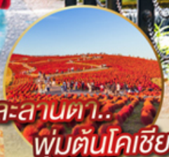
ละลานตา... พุ่มต้นโคเชีย