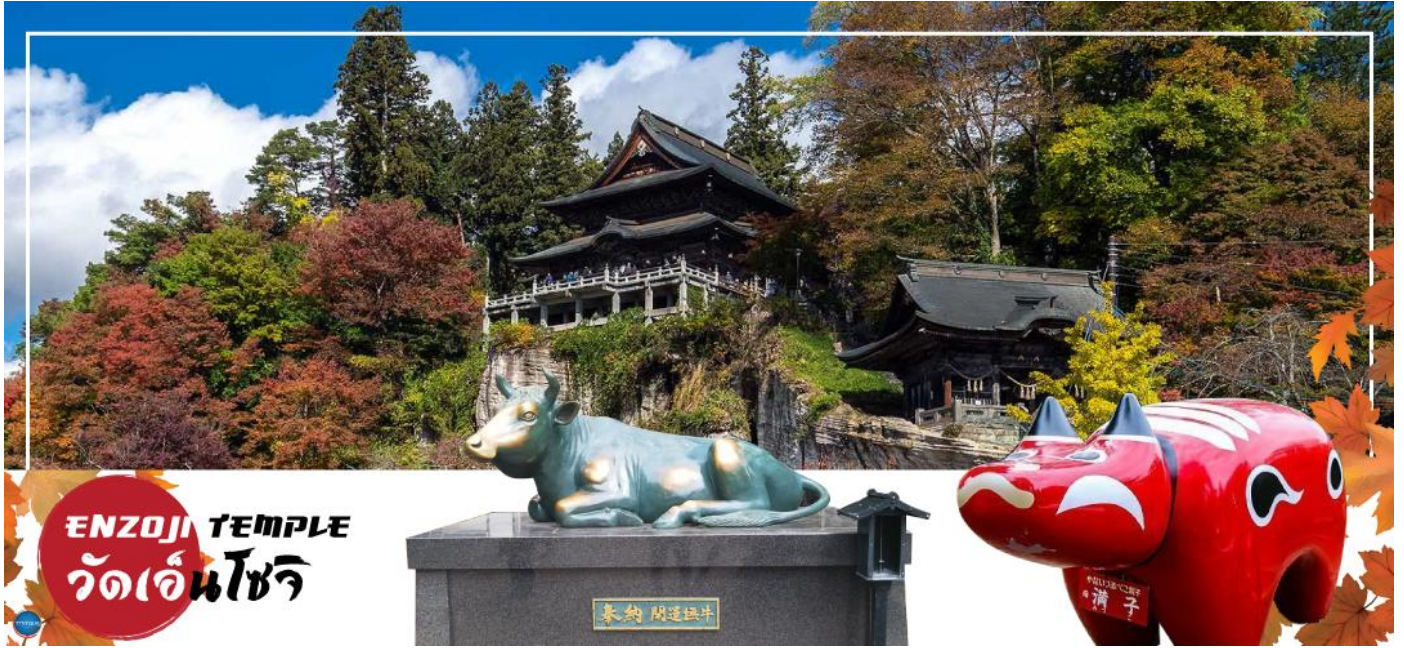
ENZOJI TEMPLE วัดเอ็นโซจิ

เดินทางสู่ เมืองยุโนคามิ ออนเซน (ใช้เวลาเดินทางประมาณ 1 ชั่วโมง) เป็นเมืองตากอากาศออนเซนเล็กๆ ที่มีชื่อเสียงของจังหวัดฟุกุชิมะ