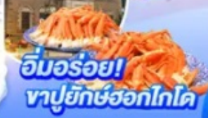
อิมมอร์ออย! มาปูยักษ์ฮอกไกโด