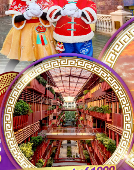
The street of 1000 red jars

สักการะพระใหญ่หลิงชานต้าฟอ ถ่ายรูปคู่กันดั้มยักษ์ ชมสุดยอดพุทธศิลป์ร่วมสมัยของจีน "ศาลาฟานกง"