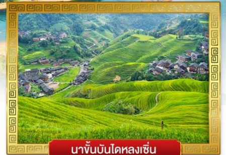
นาขั้นบันไดหลงเซ็น