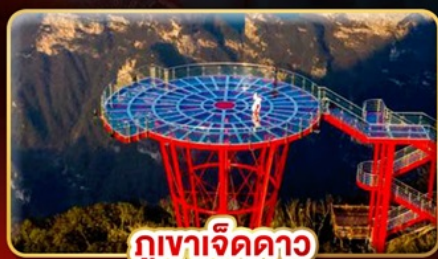
ภูเขาคีรีคาว