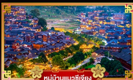
หมู่บ้านแมวซีเจียง