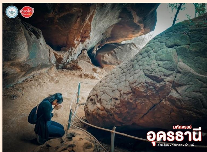
SHA 4+ ไทยไทย ที่ใจเกิด