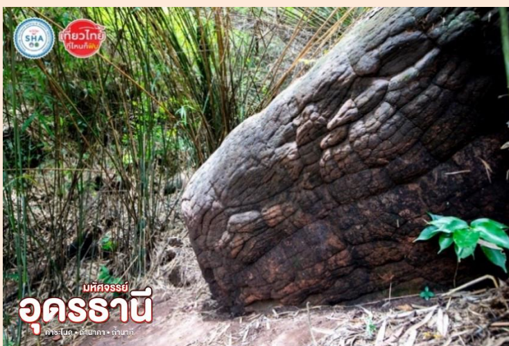
SHA 4+ ไทยไทย ที่ใจเกิด