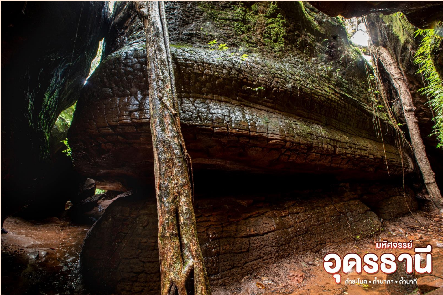
มหัสจรรย์ อุทยานนี้ คำชะโนด • ถ้ำนาคา • ถ้ำนาคี