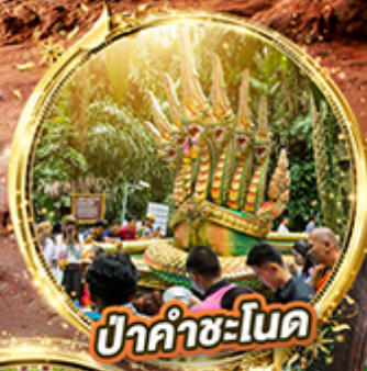
ป่าคำชะโนด