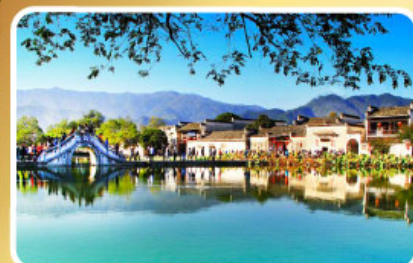
หมู่บ้านผดโลก หงซุน