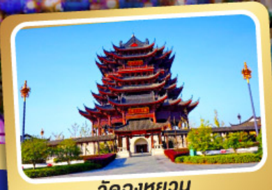
วัดดวงหยวน