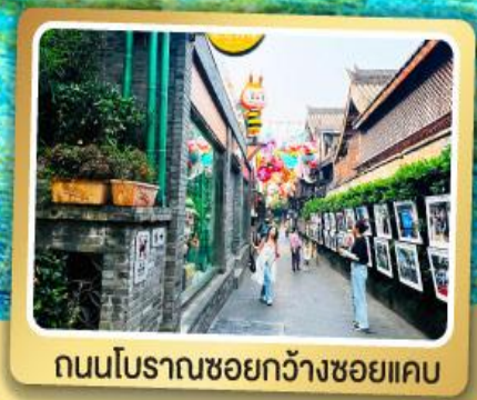
ถนนโบราณชอยกวางชอยแคบ