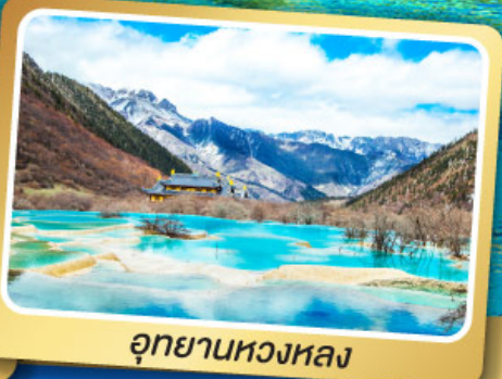
อุทยานหองหลง