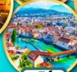
ลูเซิร์น