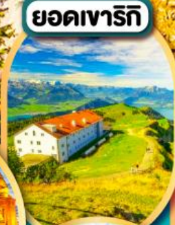
ยอดเขารีกิ