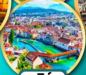
ลูเซิร์น