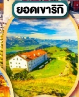
ยอดเขารีกิ