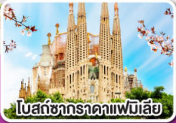
โบสถ์ซากกราดาแฟมิเลีย