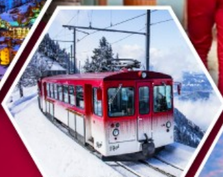
รถไฟใต้เขาริกิ