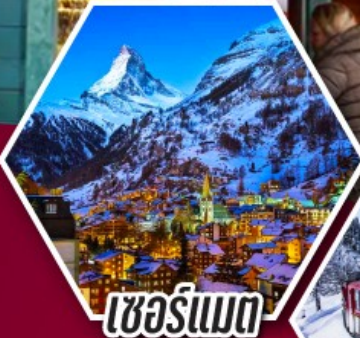
เซอร์แมท