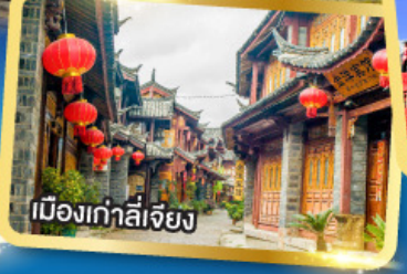
เมืองเกาลีเจียง