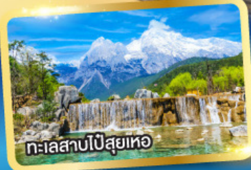
ทะเลสาบโป๋ส่วยเหอ