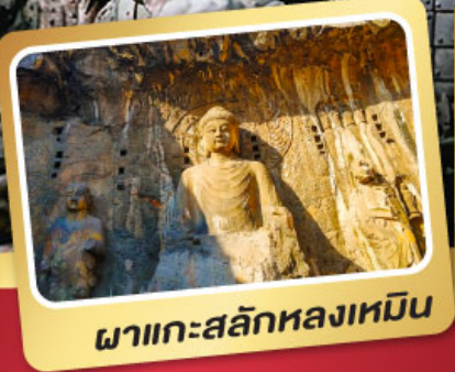
พวาทะสลักหลงเหมิน