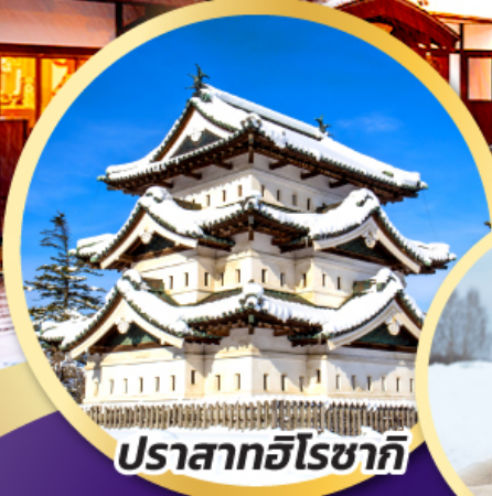
ปราสาทฮิโรซากิ