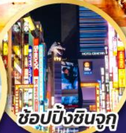
ช้อปปิ้งชินจูกุ