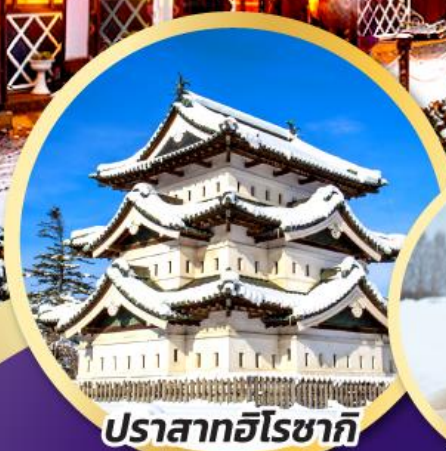
ปราสาทฮิโรซากิ