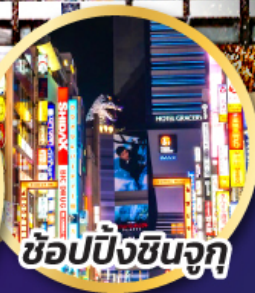
ช้อปปิ้งชินจูกุ