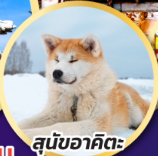
สุนัขอาคิตะ