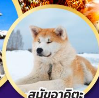
สุนัขอาคิตะ