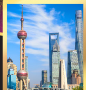
เซี่ยงไฮ้