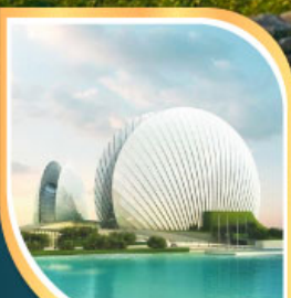
โรงแรมฮวยฮวง