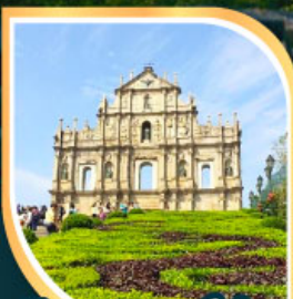
วิหารเซนต์ปอล