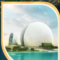
โรงละครหอยโข่มุก