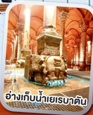
อ่างเกีบน้ำยรบาตบ