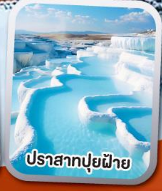
ปราสาทปุยฝ้าย